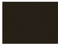
Chêne teinté 28