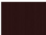
Frêne Rouge Foncé