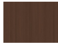
Frêne Brun Moyen