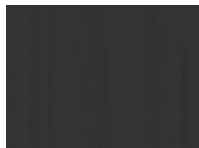
Frêne Gris Foncé