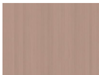
Frêne Rose Pâle