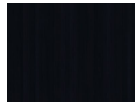
Frêne Bleu Foncé