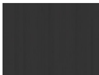
Frêne Gris Foncé